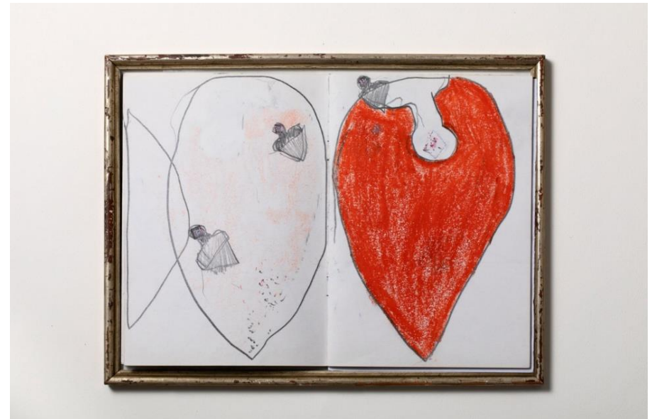
„Spitzentanz“, 2023, Buch, 30 Seiten, Ölkreiden, Graphit, 21 cm x 15 cm

Eigeninszenierung eines ewigen Theaters, des reflektierenden Umgangs mit uns selbst.