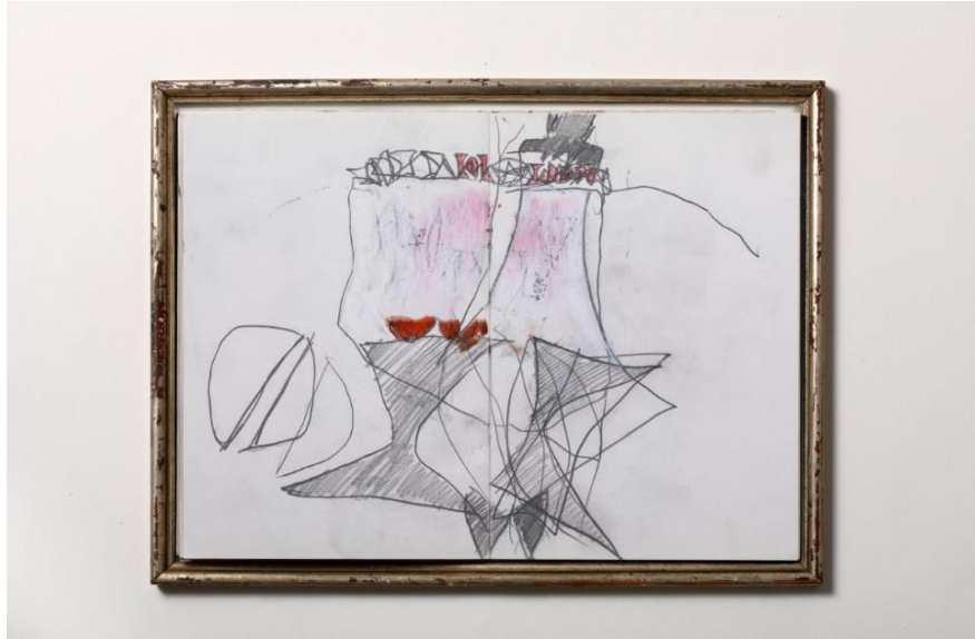
„Spitzentanz“, 2023, Buch, 30 Seiten Ölkreiden, Graphit, 21 cm x 15 cm